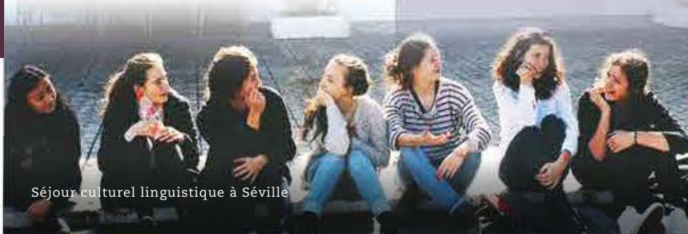
Séjour culturel linguistique à Séville

« La technologie prend sa juste place à l'École. La tablette numérique est utilisée en classe, dans un contexte qui préserve avant toute chose la qualité de la relation enseignant-élève. L'innovation est omniprésente, en ne sacrifiant jamais rien aux relations humaines ou aux méthodes éprouvées qui ont bâti la réputation de l'institution au cours des cent dix dernières années. »