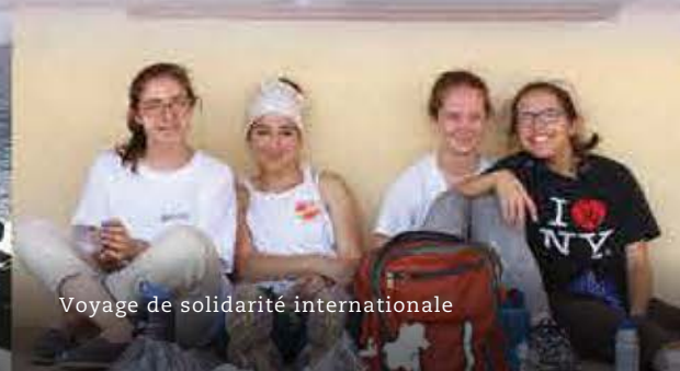
Voyage de solidarité internationale