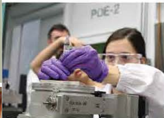
Projet Students on the Beamlines