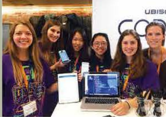
Projet Technovation Challenge

Plusieurs bourses sont offertes par la Fondation du Pensionnat du Saint-Nom-de-Marie. Pour plus de renseignements, veuillez consulter la section Fondation de notre site Internet ou communiquer avec nous au 514 735-5261, poste 3036.